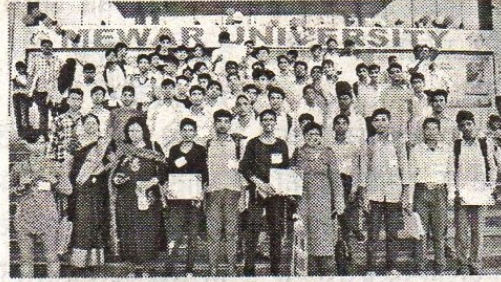
प्रतियोगिताओं में भाग लेने पहुंचे विद्यार्थी।